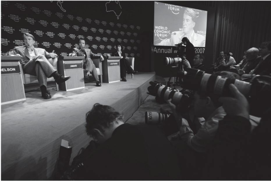
اجتماع منتدى الاقتصاد العالمي